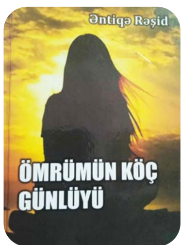
günlüyü" ilk kitabım artıq əlimdədi və indi başa düşəndə ki, adamın ki-

Elə bil çoxdan bir-birini görməyən yaxınlar, qohumlar bir yere yığılmışdılar. Nəfər əldə-əbdada bir əzizinin xeyir işi, toy mərasimi olur, hamı sevinsin-gülə-yığılın ha o əzizinin evinə... eynən heyəl! Bu gün həsrət-lə çapını gözlədiyim "Ömrümün köç günlüyü" və indi başa düşəndə ki, adamın ki-