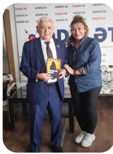
tabının çapdan çıxması ilə-bələ sızradan bir şey deyil, əsl toy-şənlik